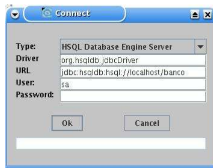
Figura 1. Interface de conexão do Database Manager.

Note que o aplicativo está dentro do pacote útil e duas versões são disponibilizadas: uma versão utilizando uma interface baseada no conjunto de componentes gráficos do pacote AWT; e uma versão que utiliza componentes Swing. A figura 1 apresenta a interface de conexão da ferramenta com um banco de dados. A versão Swing foi utilizada para exemplificação.